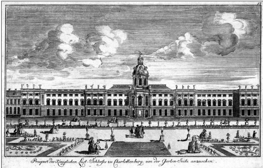
Prospect des Königl. Lust-Schlusses zu Charlottenburg, von der Garten-Seite anzusehen.