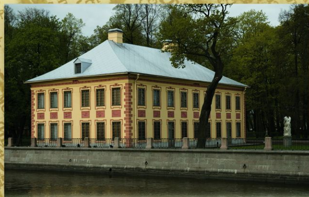
Летний дворец Петра Первого. Одно из старейших каменных зданий города. Построен в 1710—1712 в Летнем саду (арх. Д. Трезини, А. Шлютер, Н. Микетти). Петр I жил здесь в летнее время с 1712 до самой смерти. С 1934 здесь действует музей.