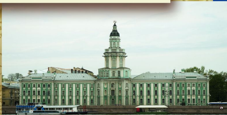
Кунсткамера. Старейший музей России. Учрежден в 1714 на основе личных коллекций Петра I. С 1727 размещается в специально построенном здании (1718—1734, арх. Г. Маттарнови, Н. Ф. Гербель, Г. Киавери, М. Г. Земцов).