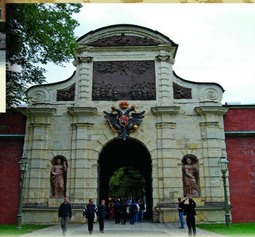
Петровские ворота. Парадные ворота Петропавловской крепости построены в 1708, перестроены в 1716—1717 по проекту Д. Трезини. Единственный сохранившийся образец триумфального сооружения петровского барокко.