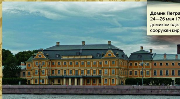
Меншиковский дворец. Памятник архитектуры петровского барокко. Построен в 1710—1727 для светл. кн. А. Д. Меншикова (арх. Д. М. Фонтана, Г. И. Шедель). В петровское время был центром петербургской жизни: здесь проходили приемы, ассамблеи, торжества.