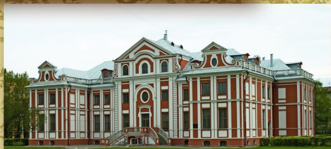
Кикины палаты. Построены в 1714—1720 для адмиралтейств-советника А. В. Кикина. После его казни за организацию побега царевича Алексея Петровича из России палаты отошли в казну. В 1719—1727 здесь размещались коллекции будущей Кунсткамеры.