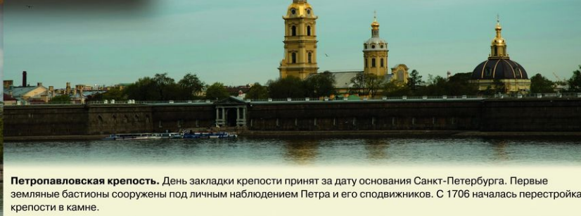
Петропавловская крепость. День закладки крепости принят за дату основания Санкт-Петербурга. Первые земляные бастионы сооружены под личным наблюдением Петра и его сподвижников. С 1706 началась перестройка крепости в камне.